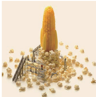
トモロコシ燃料ロケット