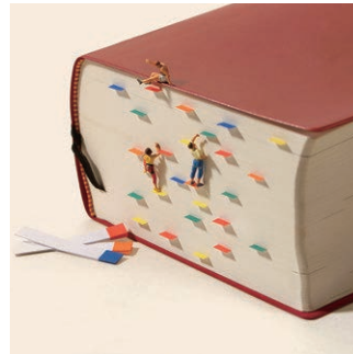
問題の解き方は人それぞれ