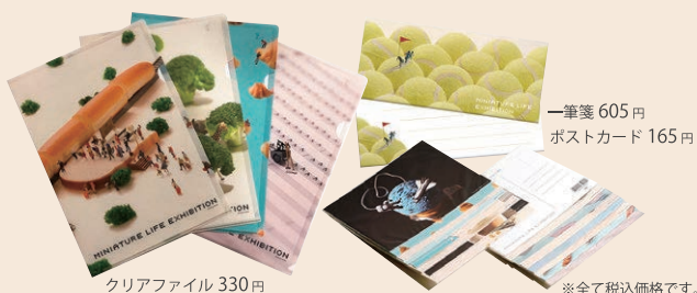
クリアファイル 330円

金森赤レンガ倉庫BAYギャラリーに、期間限定「MINIATURE LIFE展」オリジナルグッズショップがオープン！入場無料です。大きなブロッコリーが目印！！